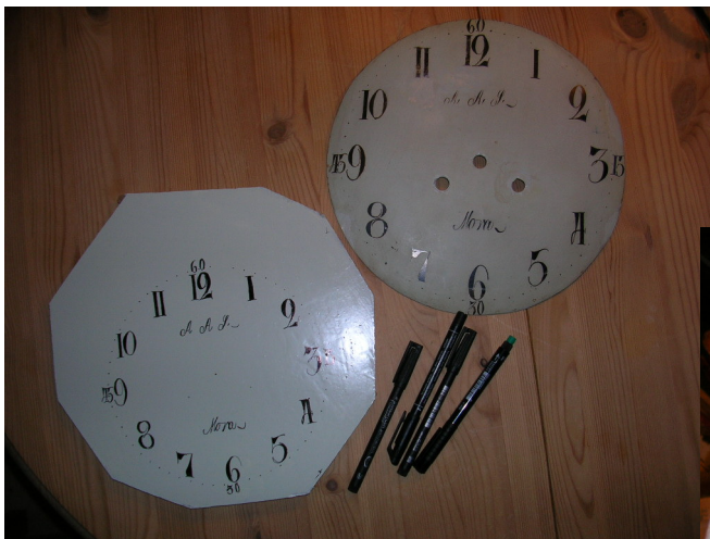
Kopien på træpladen blev faktisk rigtig god... så nu kan jeg restaurere selve urskiven.