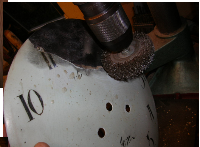
Med roterende stålborste fjerner jeg urskivens gamle maling.