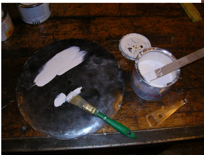
Så maler jeg 4 gange med grundmaling.