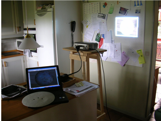
Med digitalkamera har jeg fotograferet urskiven. (den ses på computerens skærm)