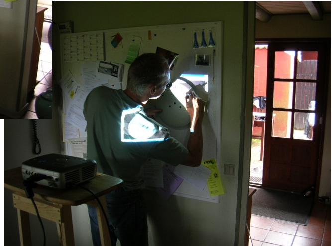
Med en projektor vises billedet på vægen hvor jeg kan tegne en kopi af urskiven på min træplade, bare lidt mindre i diameter.